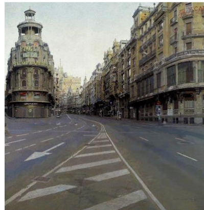
3B. Antonio López, Gran Vía de Madrid . 1974-1981.