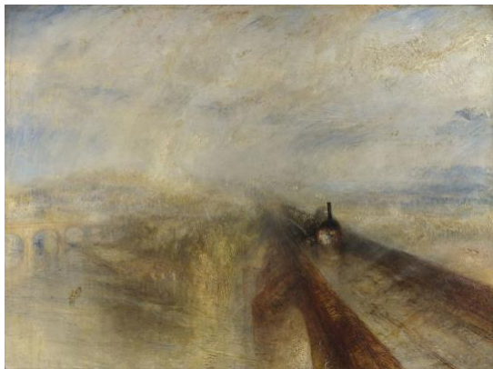
3A. William Turner, Lluvia, vapor y velocidad , 1844.