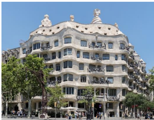
4A. Antoni Gaudí, Casa Milà o La Pedrera , 1906-1912.