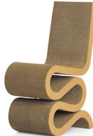
Silla Wiggly de cartón, de Frank O. Gehry, 1972.