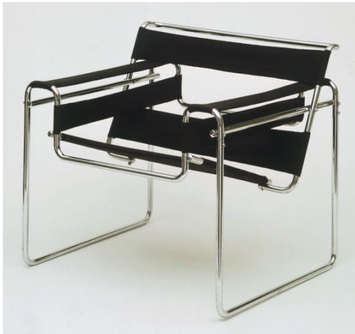
Silla B3 Wassily , de Marcel Breuer, 1927.

Se presentan dos modelos de sillas de épocas distintas de la historia del diseño. Aproximándose a uno de los estilos, diseñe una mesa auxiliar complementaria. Se deberán presentar varios bocetos en perspectiva a mano alzada y un diseño definitivo donde se muestren las vistas necesarias del objeto y sus dimensiones aproximadas.