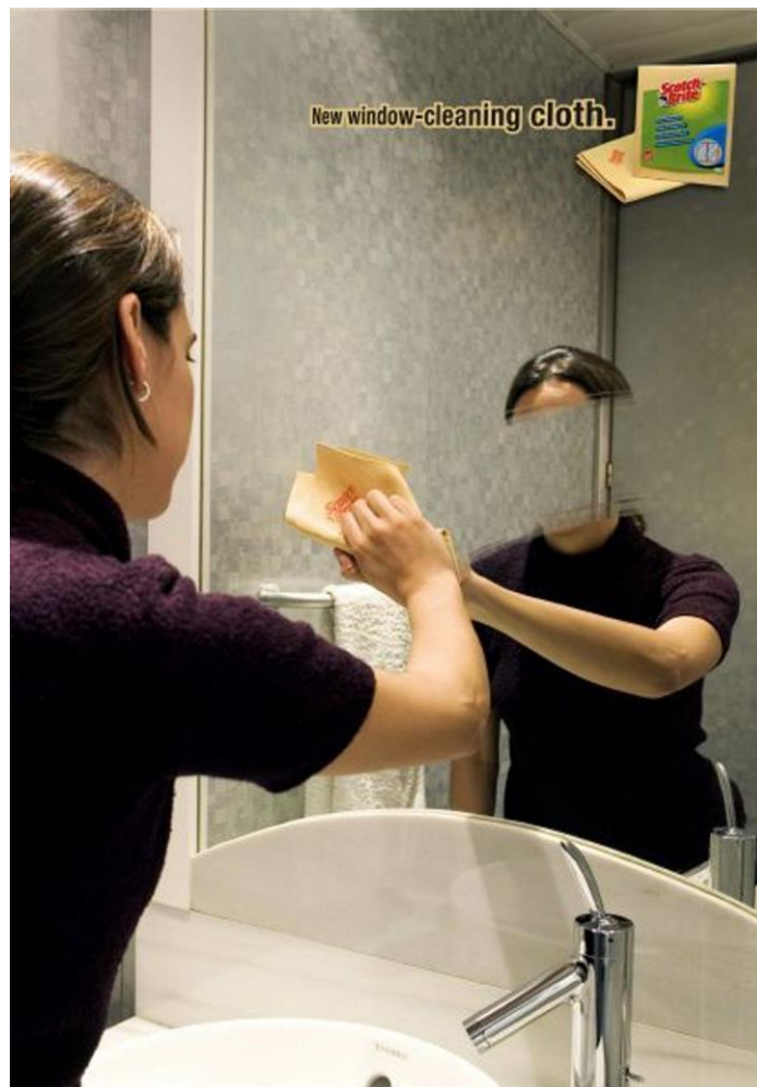
[Scotch-Brite, nuevo paño limpiacristales]